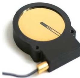
Typical Frequency Response of PA 0.4mm Uncoated Coplanar Membrane Hydrophone

This specification is subject to change without notice.