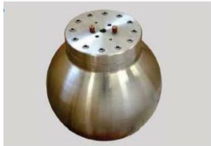
TNT 25g 用 Calorimetric Detonation Bomb